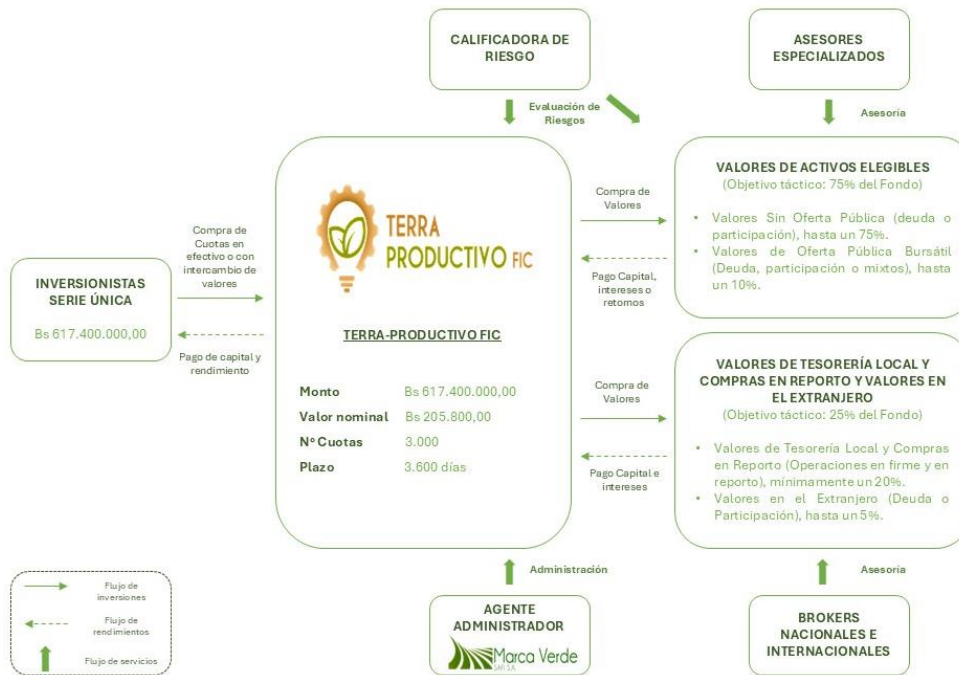
Ilustración N° 1 Participantes del Proceso de Emisión y Colocación de Valores de TERRA-PRODUCTIVO FIC