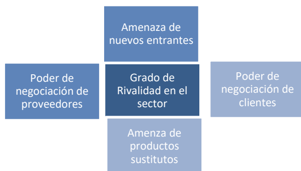
Gráfico 2: MODELO DE LAS CINCO FUERZAS COMPETITIVAS DE PORTER

FUENTE: ADAPTACIÓN DE "HOW COMPETITIVE FORCES SHAPE STRATEGY", MICHAEL E. PORTER, HARVARD BUSINESS REVIEW, MARCH-APRIL 1979